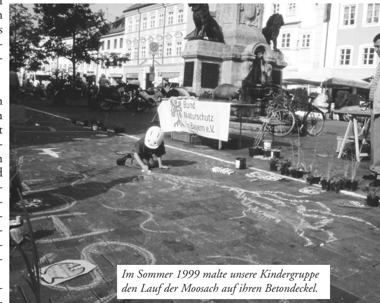
Im Sommer 1999 malte unsere Kindergruppe den Lauf der Moosach auf ihren Betondeckel.